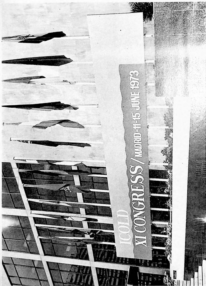
L'entrée du Palais des Congrès. Entrance of Congress Palace.